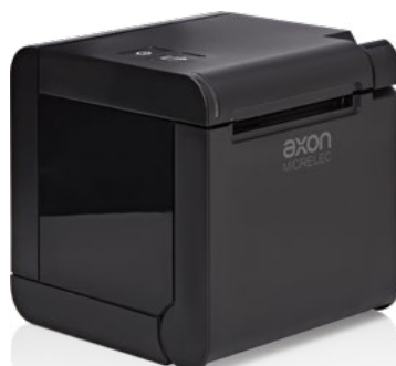
Uscita carta superiore