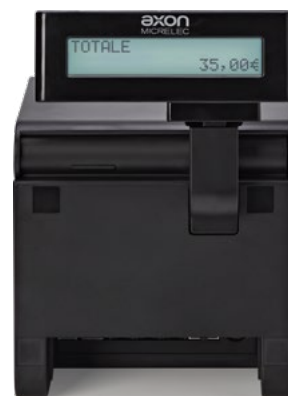
Display cliente integrato