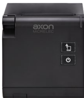
Uscita carta frontale